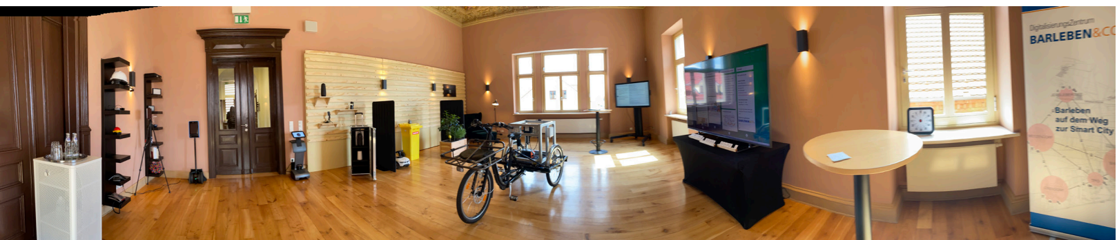
Abbildung 2: Panorama der Digitalwerkstatt Villa 147

Unsere Digitalwerkstatt ist sozusagen der Geburtsort des vorliegenden Strategiepapiers. Zu einigen Handlungsfeldern gibt es die passenden Lösungen zum Ausprobieren und Testen als Exponate hier live zu sehen. Der historische Jugendstilsaal des Haupthauses eines klassischen Barleber Vierseitgehöfts zieht Besucher, Workshopteilnehmer und Netzwerkpartner in seinen Bann. Hier macht es Spaß, zu diskutieren und eine Zukunftswelt Barleben 2030 zu bauen.