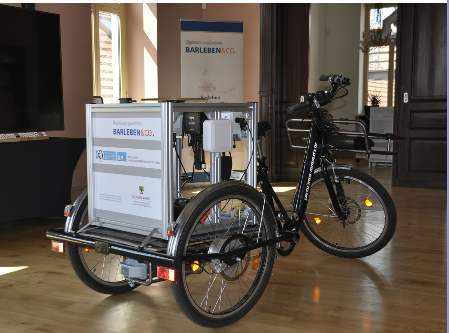
Abbildung 6: E-Lastenrad mit Sensorbox zur mobilen Erfassung von Umweltdaten