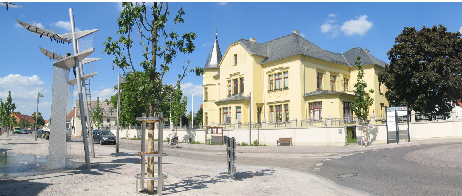
Abbildung 5: Blick auf den Barleber Verwaltungssitz