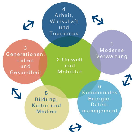
Abbildung 3: Handlungsfelder

Diese sechs Handlungsfelder sind zu Arbeitsgruppen geworden, in denen die thematische Auseinandersetzung begonnen hat und auch künftig weiter stattfindet. Für jedes Handlungsfeld wurden in den Arbeitsgruppen gemeinsam Ziele erarbeitet, die für Barleben zukunftsrelevant sind. Die zentralen Workshops der Arbeitsgruppen waren so aufgebaut, dass es zu jedem Kernthema jeweils einen Impulsvortrag aus Wirtschaft, Wissenschaft oder anderer Expertensicht gab. Dies hat den Teilnehmern geholfen, fachspezifische Besonderheiten zum Thema einführend zu erfahren.