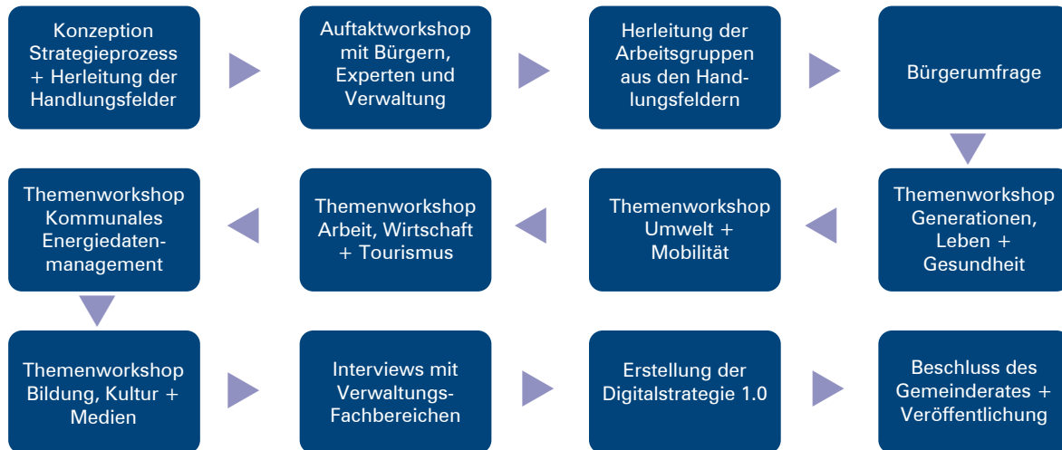
Abbildung 4: Strategieprozess

Herzstück im gesamten Prozess stellt unsere Bürgerumfrage 3 dar. Damit wir möglichst jede Altersgruppe erreichen, haben wir alle verfügbaren Kommunikationskanäle genutzt: