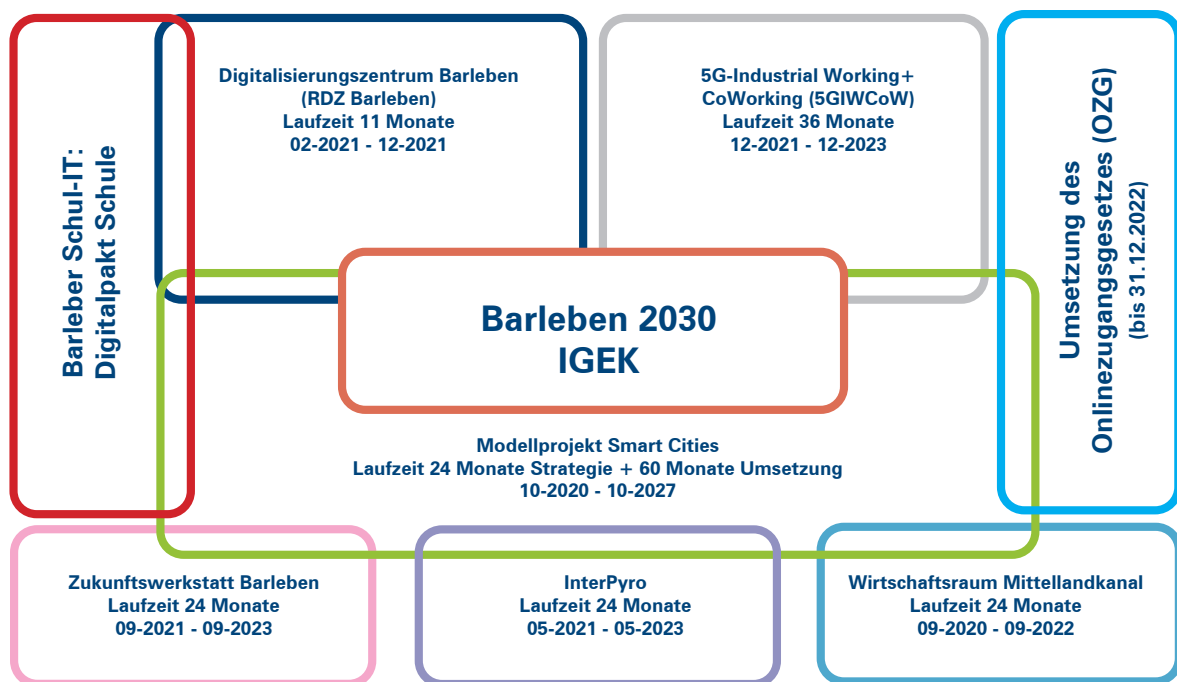
Abbildung 1: Barlebens Projektvielfalt

Da uns unsere Zukunft sehr wichtig ist, haben die Projektstrategen in der Gemeindeverwaltung an den verschiedensten Ideenwettbewerben, Ausschreibungen und Projektaufrufen teilgenommen. Es wurden zahlreiche Projektkonzepte erstellt und bei den verschiedensten Projektträgern im Land und beim Bund eingereicht. Mit Stolz können wir sagen, dass wir mit der erreichten „Mixtur“ eine mehr als solide Basis für die Finanzierung all unserer Vorhaben schaffen konnten. Der ganz besondere Gewinn jedoch ist der interkommunale Austausch zu all den Zukunftsthemen, den wir zum Beispiel in der Smart-City-Community ganz besonders intensiv erleben. Es ist uns bisher gelungen, die Ergebnisse aufeinander abzustimmen, zu verwerten und als neue Basis für die nächstgrößeren Vorhaben einzusetzen. In der folgenden Darstellung ist unsere Projektlandschaft dargestellt – umgeben von den ohnehin auf der Tagesordnung stehenden Aufgaben, wie zum Beispiel die Umsetzung des Onlinezugangsgesetzes.